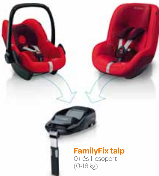
FamilyFix talp 0+ és 1. csoport (0-18 kg)